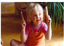
Musikgarten Phase 1 "Gemeinsam musizieren" - Kinder von 18 Monaten bis 3 Jahre