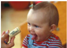
Musikgarten für Babys - Säuglinge bis 18 Monate